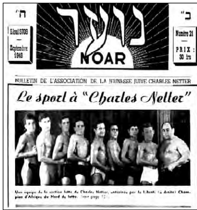
עיתון "נוער", ספטמבר 1948