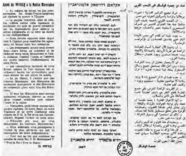
כרוז של ארגון אליויפאק

אשר לבעיית היציאה לעבר אופקים חדשים של גורמים יהודיים אחדים שלא הצליחו להתאים את עצמם לקצב הכללי החדש של המדינה, הבענו יותר מפעם אחת את דעתנו על זה. אולם, אין אנו יכולים לעמוד בפיתוי להביא את דברי עלאל אלפאסי עת היה שר ולעומתם את דבריו כשעבר לאופוזיציה. אז יתברר מה ההבדל בין מפלגה קואליציונית ובין מפלגת אופוזיציה. היהודים אינם נושא למיקוח פוליטי שמנצלות