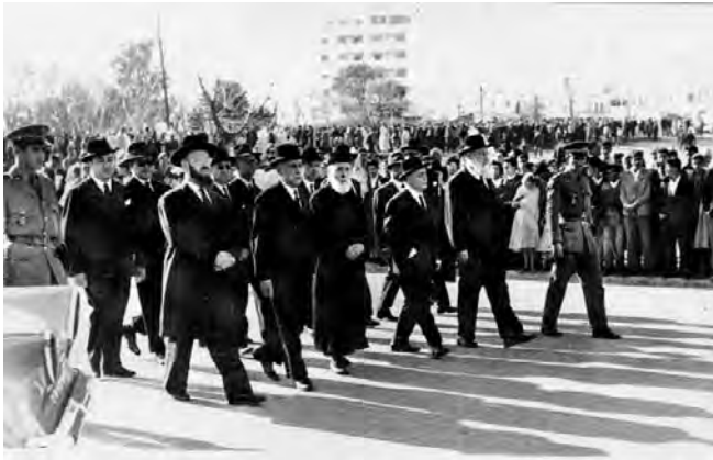
ראשי הקהילה בתהלוכה אחרי מות המלך מוחמד החמישי בפברואר 1961

המרקונים, החיים בעוני כמו המוסלמים המרוקנים. יש להסביר להם שהם מנוצלים וכי האינטרסים שלהם ושל המוסלמים זהים. 76