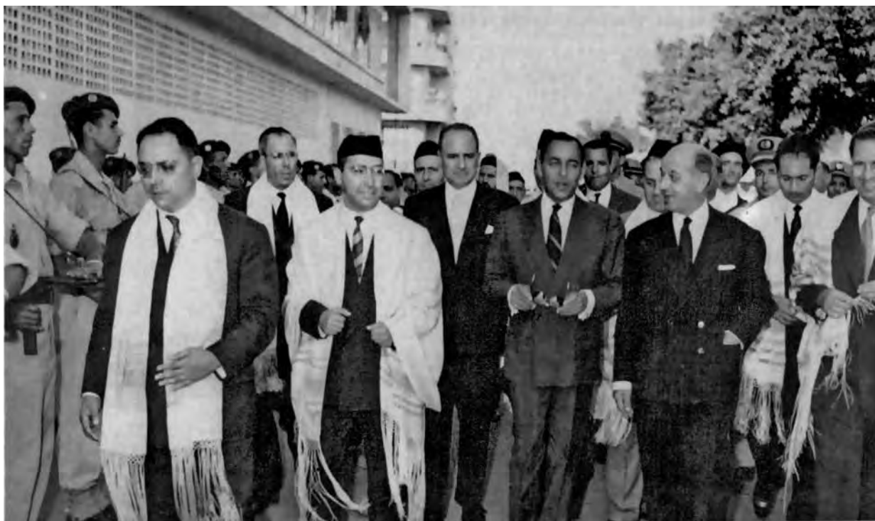
המלך חסן השני עם ראשי הקהילה ביציאה מבית כנסת ביום כיפור בקזבלנקה

העממיים ופרסם סדרת מאמרים בעיתון המפלגה L'Avant Garde , שהופיע מדצמבר 1959 כמוסף לעיתון אתחרייר הערבי.