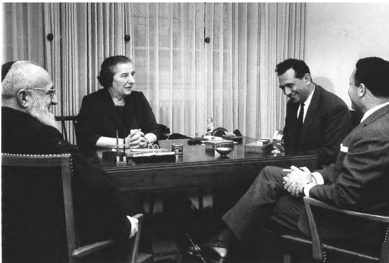
ביקור נשיא הקהילה דוד עמר אצל גולדה מאיר עם נציג המוסד בנימין רותם

קהילת קזבלנקה, שרב העיר וראשי הקהילה לא השתתפו בקבלות הפנים כיוון שלא הוזמנו אליהן. 60 נראה שהשלטונות היו מפוכחים דיים כדי שלא להביך את ההנהגה היהודית עם הזמנה מסוג זה. עם זאת, איחוד העבודה המרוקני קיים כנס מוסלמי-יהודי ב-10 בינואר במחאה על פעולות המשטרה. 61 ההתנכלויות לא אירעו בימי ממשלת השמאל שהואשמה בניהול מדיניות פאן-ערבית, אלא בימי שלטון מוחמד החמישי ובנו, שהסתייגו מאישיות נאצר וחששו מחתרנות. סדרת האירועים שהחלו בהתפרצות האנטי-יהודית בוועידת קזבלנקה ואחר כך אסון טביעת ספינת העולים "אגוז" ב-10 בינואר 1961, ההתקפות בעיתונות הבין-לאומית על השלטונות המרוקניים ועל המעצרים, הניעו את ראשי הקהילה לבקש פגישה עם המלך. הם התכוונו לנקוט פעולה שתמנע התפרצות אלימה של ציבור מוסלמי בתגובה על הפצת כרוז ישראלי שהאשים את מרוקו באחריות לטביעת ספינת העולים. בעקבות סדרת מעצרים שביצעה משטרת מרוקו בקרב מתנדבי "המסגרת", הרשת המחתרנית שפעלה משנת 1955 סיימה סופית את תפקידה באוגוסט 1961.