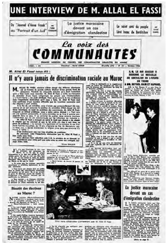
ביטאון הקהילה "קול הקהילות" אוקטובר 1962

מעמדם הכלכלי של היהודים היה דומה לזה של המתישבים הצרפתים במרוקו. למרות השוני בנתינות, היהודים היו צרכנים טובים וכוח אדם מיומן למשרות ניהול. לדברי ההיסטוריון דניאל רינה, "לא יהיה מוגזם לקבוע שעזיבת הקהילה עלולה לרושש מבחינה אנושית את מרוקו יותר משובם של האירופים לצפון הים-התיכון". 9 מעיני היהודים לא נעלם החשש מפני מה שעלול לקרות משתגבר המדינה על קשיי ההסתגלות לעצמאות הכלכלית והמדינית, אך לתביעה לחופש תנועה ולהענקת דרכונים לא הייתה משמעות מעשית. דרישות אלה יכלו לענות, לכל היותר, על צורכיהם של סוחרים ושל בעלי עסקים שביקשו לצאת לאירופה לרגל עסקיהם או לחופשה. יהודי הכפרים והשכבות העממיות בערים היו זקוקים לסיועו של גוף שיארגן את יציאתם, יטפל בהובלת רכושם וידאג לקליטתם בארץ חדשה. אך נציגי הארגונים היהודיים העולמיים העדיפו להזכיר לראשי השלטון תביעות עקרוניות כחופש תנועה והנפקת דרכונים, ולא ארגון הגירה שיטתית של אזרחיה היהודים של מרוקו לישראל. כיוון שההתנגדות העקרונית להגירה שימשה נשק פוליטי בידי המפלגות בהתקפותיהן ההדדיות ובהתנגדותן למדיניות הארמון,